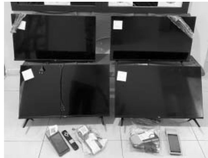
Material apreendido após operação nos estabelecimentos comerciais

Delegacia Especializada, disse que o combate a esse tipo de contravenção penal é muito importante no controle da criminalidade em um município, já que, não raro, por trás desses meros apontadores, tal como são chamados os comerciantes que aceitam receber e instalarem esses equipamentos em seus estabelecimentos comerciais, em troca de pequenas ou reduzidas quantias em dinheiro, quase sempre se detecta a presença de estruturados grupos criminosos.