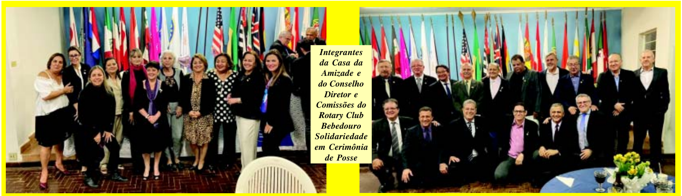
Integrantes da Casa da Amizade e do Conselho Diretor e Comissões do Rotary Club Bebedouro Solidariedade em Cerimônia de Posse