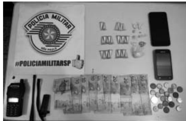
Apreensão promovida pela PM na Avenida Belmiro Dias Batista no Jardim Souza Lima

Na noite do sábado (9), a equipe Romu da Guarda Municipal em patrulhamento pela Rua Antônio Ambrósio, Residencial Bebedouro avistou um indivíduo em atitude suspeita. "Foi feita a abordagem no indivíduo e em revista pessoal foi localizada em poder do mesmo R$ 50,00 em notas diversas e próximo do local onde ele estava foram localizadas quatro pedras de crack e três papelotes de maconha. Diante dos fatos, o in-