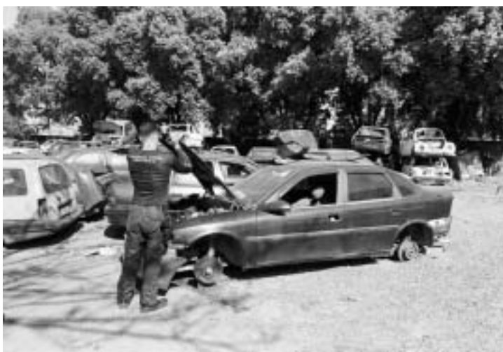
Polícia Civil averigua condições de estabelecimento no município

Ao cumprir diretriz do Deinter 3 (Departamento de Polícia Judiciária de São Paulo Interior) Ribeirão Preto, a