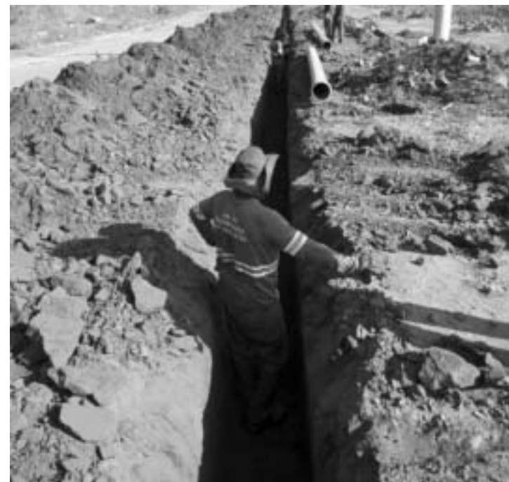
Instalação da rede adutora pelo Jardim Parati, que passa pela Avenida Ceriana Cesar até o Poço Profundo

resfriador, e pedi para fazer novamente as soldas em vários pontos. Não estamos tendo problema algum de abastecimento de água. Aquele setor está tranquilo. Está em uma época de frio e o consumo não é tão alto. Poço está pronto, e cada detalhe e equipamento vamos fazer da melhor maneira possível para que a gente deixe uma herança muito bonita para Bebedouro. O abastecimento de redes será mais uniforme para uso diário da população. Já a torre é uma etapa importante, responsável por resfriar a água do Aquífero Guarani, já que sua temperatura prejudicaria o sistema de distribuição".