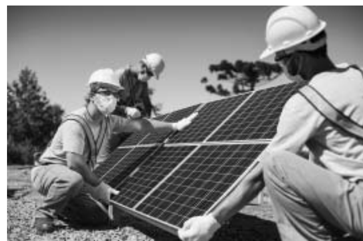
Ação sustentável ganha incentivo através da concessão de crédito

veis, dedicada à captação de recursos para a geração de valor à sociedade e ao meio ambiente. Em 2021, essa estrutura coordenou a captação de US$ 120 milhões junto à International Finance Corporation (IFC), membro do Banco Mundial, focada em atender à crescente demanda por crédito destinado à instalação de sistemas de energia solar. "Nós temos como compromisso apoiar as pessoas em suas necessidades financeiras e cada vez mais temos aliado isso ao fomento de soluções