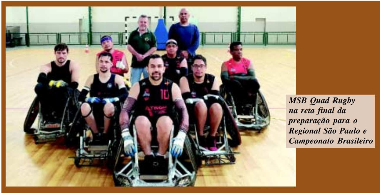
MSB Quad Rugby na reta final da preparação para o Regional São Paulo e Campeonato Brasileiro