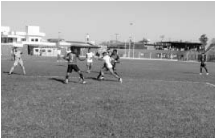
Sistema defensivo eficiente garante o 0 no placar entre Inter e Flamengo

Pelo segundo jogo do turno da 2ª fase do Campeonato Paulista da 2ª Divisão, a