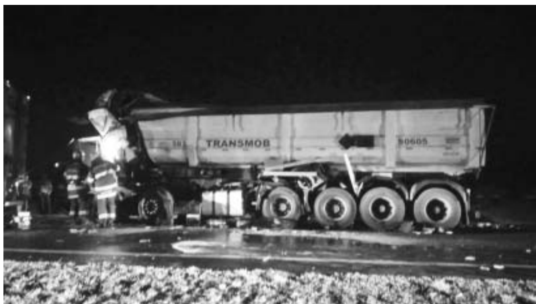
Atendimento do Corpo de Bombeiros pela Rodovia Brigadeiro Faria Lima

Homicídio - Na saída da Festa do Cavalo em Colina no sábado (9), um homem de 45 anos foi morto com ao menos cinco tiros na cabeça, no qual foi abordado quando entrava no carro que estava estacionado pela Avenida Rui Barbosa, de acordo com a Polícia Militar, que ainda enfatizou que o suspeito não foi identificado, e o caso segue sendo investigado pela Polícia Civil no sentido de apurar o motivo.