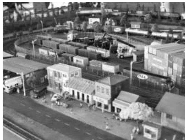
Criatividade como característica na exposição de miniaturas