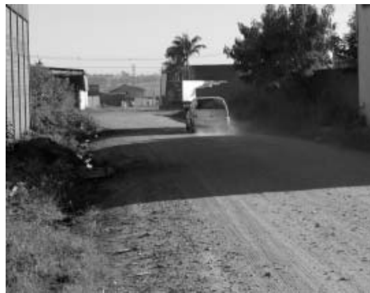
Água parada e poeira levantada pela Rua Rafael José de Oliveira

Vale lembrar que reclamações em nível poeira, lama, sujeira, lixo, entulho, risco de acidentes e água parada continuam. Em resumo tudo consiste entre a competência da gestão pública e da educação da população. "Produzimos diariamente diversos projetos de infraestrutura como recapeamento, capeamento, drenagem, etc. Analisamos diversos problemas existentes na cidade e estudamos formas de resolve-los. Todos esses