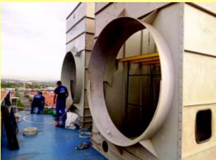
Montagem dos resfriadores entre as etapas da reta final da obra