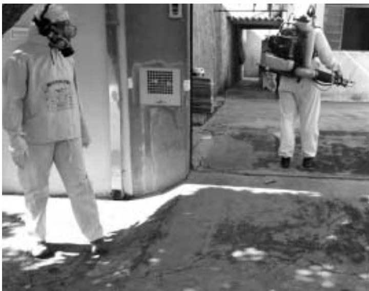
Nebulização está entre as ações da força tarefa contra a dengue

A varredura epidemiológica da Secretaria de Saúde, por meio da Vigilância Epidemiológica passará mais uma vez na região norte. A força-tarefa acontece hoje (16) nos bairros Primavera, Moria, Rassin Dib, Vale do Sol e São Fernando, das 07h às 14h.