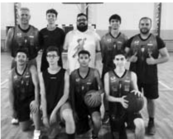
BC Basquete e Wevertons definem quem será o campeão do Torneio de Inverno

A partir das 18h30 de terça-feira (19), Wevertons x BC Basquete disputam a final da edição que homenageia o Jornalista Eduardo Iha. Na sequência será definida a 3ª e